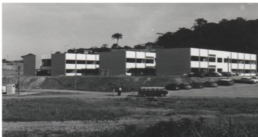
Figura 1 – Construção dos Blocos A, B, C do Campus 1 em 1969

O desenvolvimento da infraestrutura física da FURB pode ser dividido em três períodos: estruturação, crescimento e qualificação. No primeiro período, que vai até a construção de seu campus próprio (Campus 1), no ano de 1969, a preocupação foi de conseguir os meios necessários para garantir o básico para o funcionamento de seus cursos. A figura 1 mostra foto desse Campus, quando de sua inauguração.